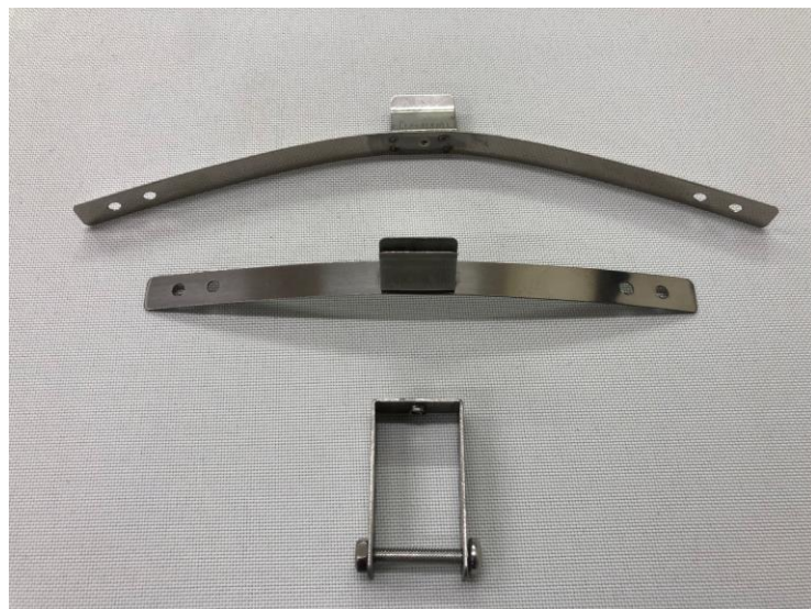
ドレンキャップ取り付け部材